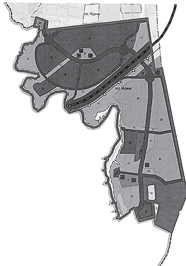
Граница территории, применительно к которой осуществляется подготовка документации по планировке территории