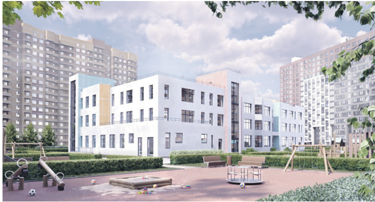
Детский сад возводится рядом с домом на улице Шоссе в Лаврики, 51, в рамках жилого проекта «Мурино Space».

На стройплощадке дошкольного учреждения в Мурине завершены работы нулевого цикла, начался монтаж монолитных конструкций,